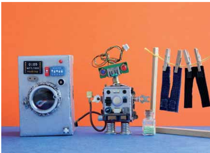
Prozesse sind zu beschreiben und zu visualisieren

Bei der Anfertigung der Prozessablaufdarstellung (Flow-Charts) werden Tools für Prozessdesign und -visualisierung (Office-Anwendungen, Prozessvisualisierungstools, Signavio, ARIS etc.) eingesetzt. Für eine prozessübergreifende Einheitlichkeit in der Darstellung empfiehlt sich die Anwendung eines Prozessvisualisierungs-Frameworks (Business Process Modelling Notation, Ereignisgesteuerte Prozessketten etc.). Wie für alle Dokumentationsunterlagen ist auch für die Prozessdokumentation sicherzustellen, dass Änderungen